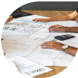
Bureau d'étude et architecte